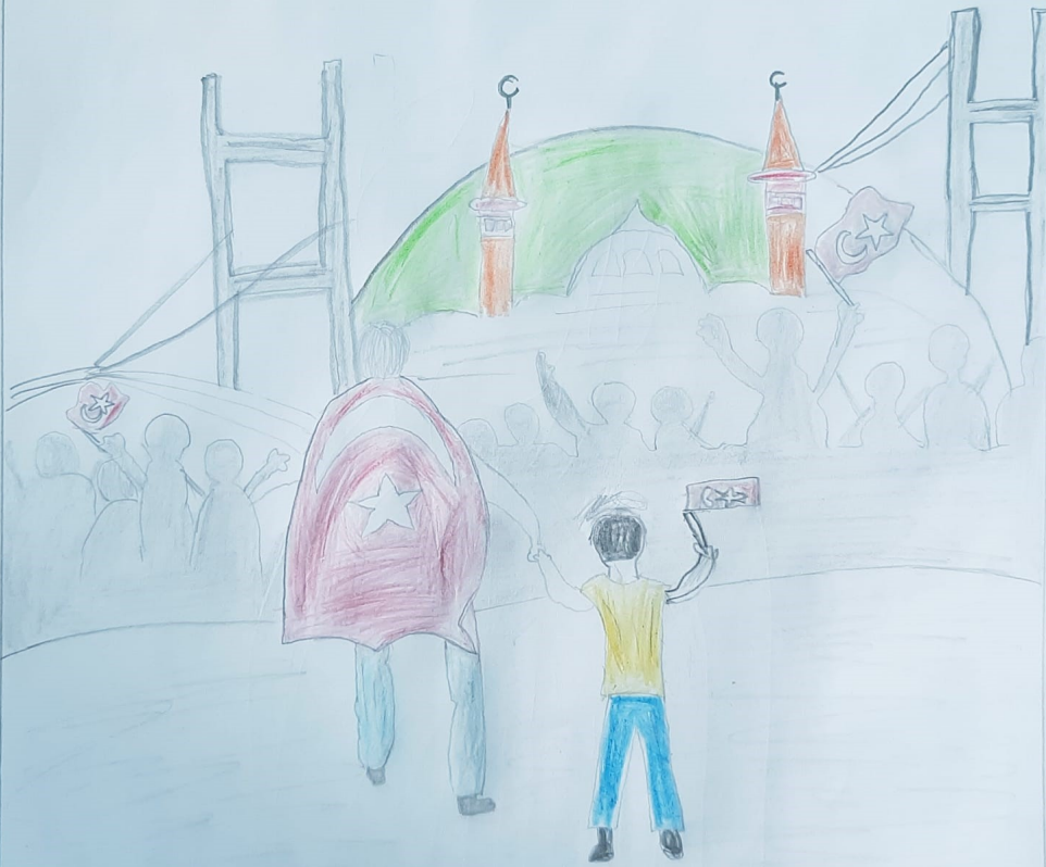
Burak Efe Kızıoğlu